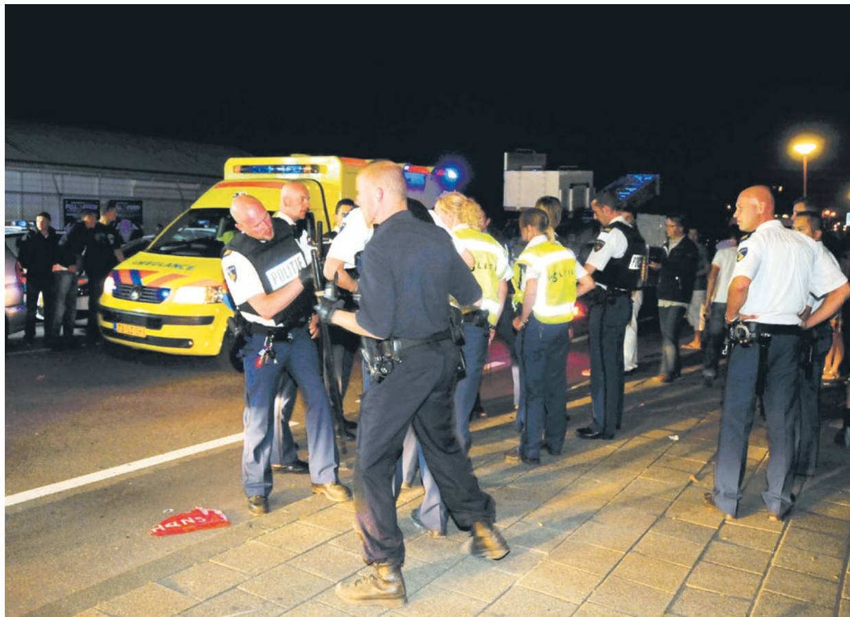
Tijdens de rellen bij Hoek van Holland, vorige maand, konden de aanwezige hulpdiensten vaak geen contact met elkaar krijgen.

Een woordvoerder van het ministerie van Binnenlandse Zaken meldt dat het onderzoek zich zal toespitsen op het gebruik maar dat ook gekeken wordt naar de technologie, met name naar de dekking van de zendmasten. "De techniek voldoet maar er wordt niet op een slimme manier gebruik van gemaakt." Dat ligt ook aan verkeerde voorschriften. De regels die