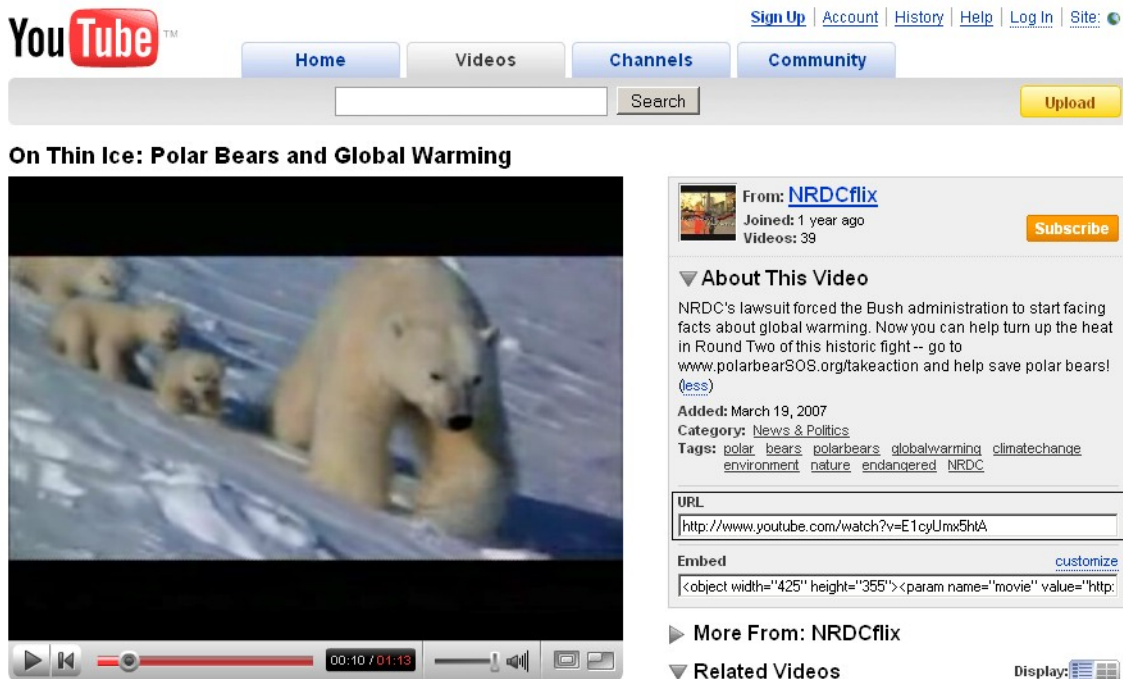
Figuur 3: Youtube filmpje

Open de website http://www.youtube.com in je browser. Zoek nu een filmpje naar keuze, dat tussen de 30 seconden en 1 minuut lang is, op Youtube. Op de Youtube pagina van jouw uitgekozen filmpje staat onder het kopje URL een link zoals: " http://www.youtube.com/watch?v=E1cyUmx5htA ". Kopieer deze link en open vervolgens in een nieuw browserscherf de website http://keepvid.com . Plak de gekopieerde link in de groene downloadbalk en klik op de knop "DOWNLOAD". Er verschijnt nu een link met de beschrijving ">> Download Link <<". Dit is de directe link naar het Youtube filmpje. Rechtsklik op de link en sla het filmpje op in de map "practicum\video" onder een duidelijke naam die eindigt met de extensie ".flv". Voorbeeld: "ijsbeer_in_gevaar_01.flv".